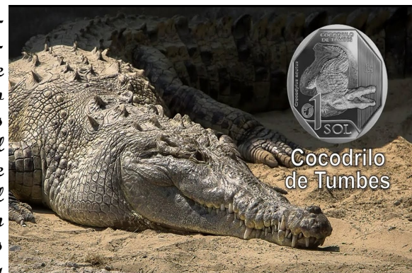
Cocodrilo de Tumbes

El Santuario Nacional “Los Manglares de Tumbes” está en la provincia de Zarumilla, en el departamento de Tumbes. Tiene una extensión de 2,972 hectáreas. Este espectacular lugar ubicado en la costa fronteriza con Ecuador es único pues alberga la mayor extensión de manglares del país. El mangle es una flora típica especial que se desarrolla en lugares salobres por la mezcla del agua salada del mar y el agua dulce del río en zonas cálidas protegidas del efecto directo de las olas, marcando la transición entre el mar y la tierra. Recorrer los manglares de Tumbes sus esteros, islas y bocanas es introducirse en un mundo de incomparable belleza y espiritualidad pues sus aguas mansas reflejan el verdor del follaje que alberga una diversidad de especies como moluscos, crustáceos, peces y aves de importancia. Asimismo, son refugio para el cocodrilo de Tumbes, en vía de extinción y hoy criado en cautiverio en el Zoológico de Cocodrilos de Puerto Pizarro. En el 2016 la UNESCO incluyó al Santuario Nacional Manglares de Tumbes como Zona Núcleo de la Reserva de Biosfera Noroeste Amotapes-Manglares, junto con el bosque seco del Ecuador, o “Bosques de la Paz”.